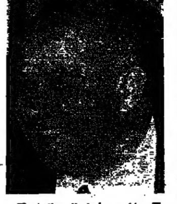
المرحوم اميل البستاني

ان لها علاقة مباشرة بالمرجع . وسيتم استماع النايبين بواسطة رئاسة مجلس النواب . وفي غضون ذلك ، اوصحت مصادر الحجة العسكرية بلايغات الاطلاق سراح سيد الاسر ، ومن لم اعادته القبض عليه . (التفاصيل على الصفحة ٥)